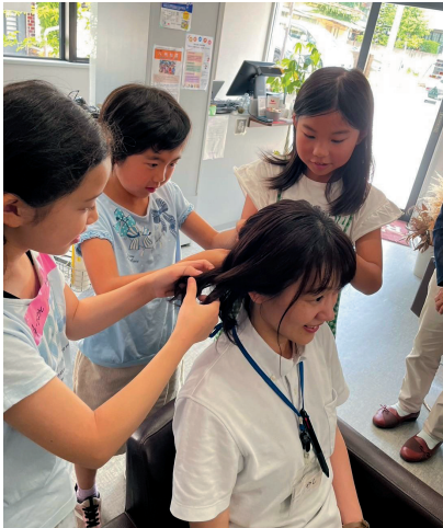
美容師体験で、三つ編みに挑戦する子どもたち