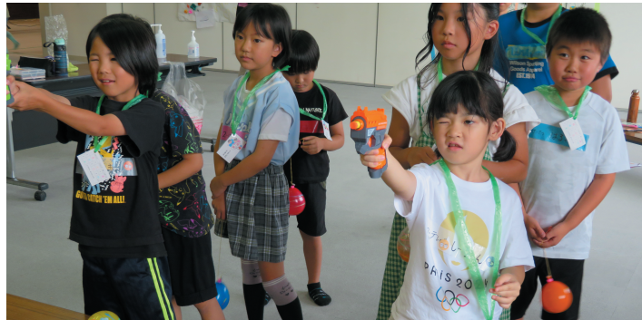
射的を楽しむ子どもたち