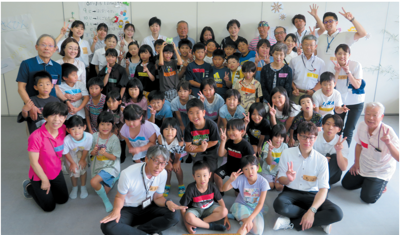
2日間ありがとうございました