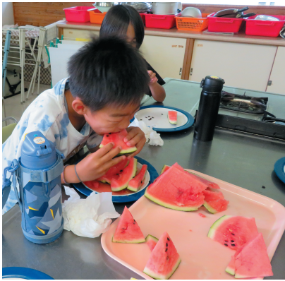
スイカ割りを楽しんだ後、子どもたちはたくさんのスイカをたべました