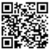
全国社会福祉協議会

「被災地のためになにかできることをしたい！」とお考えの方は、以下のQRコードから被災地支援・災害ボランティア情報をご確認ください。