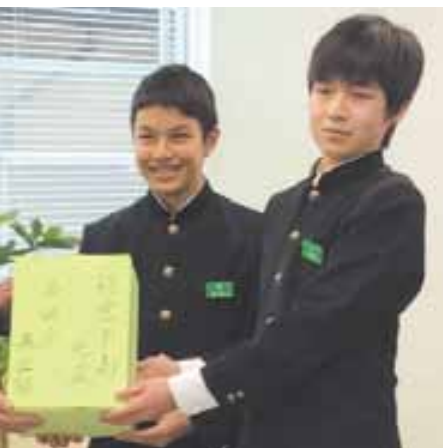
小諸東中学校生徒会

被災地にその優しいまごころが大きな励ま 芦原中学校の代表の生徒さんから手渡された お言葉も述べて頂きました。勉強にスポー で、未来の小諸市を、日本を、更には世界を、 しよう。