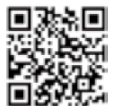
譲りあえる QRコード

（6ヵ月過ぎても残っている案件は、この「ささええるこもろ」からは削除致しますが、ホームページには継続して紹介しております。また、登録頂いている全ての写真も掲載しております。）