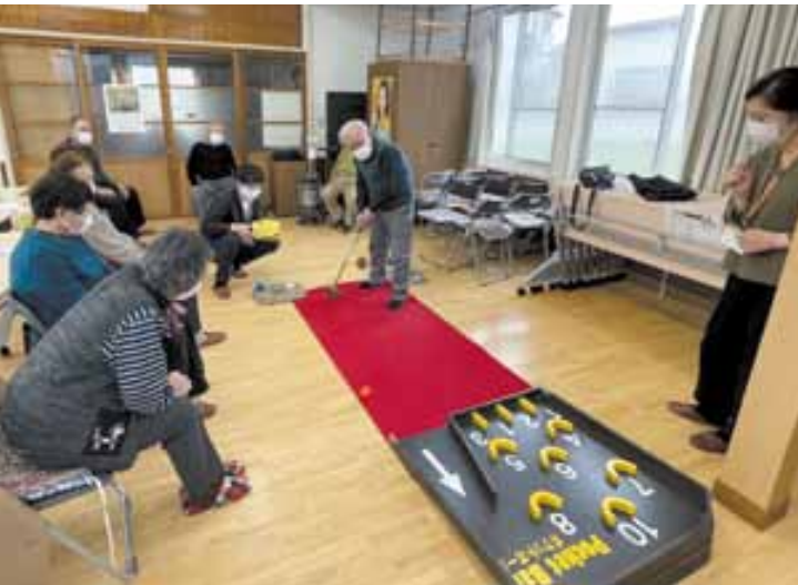
ポケットボールを楽しむ三和区の皆さん

三和区の健康達人区らぶの様子をご紹介します!4月のテーマは「介護予防と地域の支え合い」。小諸市の皆さんが新型コロナウイルス感染症の影響を特に受けたのは「口の機能」ということで、「寿限無」と「かっぱ」を音読して楽しみました。音読後は「大きな声を出すのは得意だよ」「普段静かにしているから、たくさん口を動かすと疲れるね」と皆さん笑顔で話しをしていました。最後は参加者同士点数を競う白熱したゲームを通して、身体をあたためました。