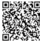
石川県民ボランティアセンター