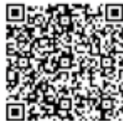
長野県社会福祉協議会