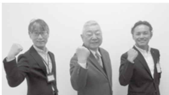
左から) 事務局長、会長、事務局次長