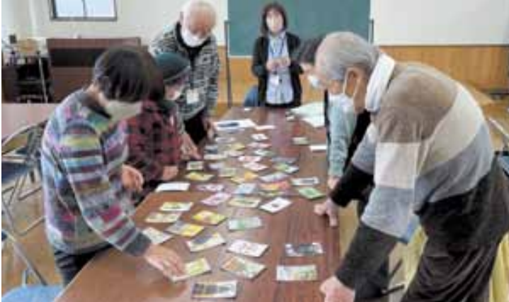
小諸かるたを楽しむ天池区の皆さん

天池区で令和6年度初の健康達人区らぶ(=達人)が開催されました!今年度から本格的に達人が始まった天池区は、現在参加者を大募集中です。この日は初めて参加された方がおり、和気あいあいとした温かい雰囲気の中迎えられています。お茶会の時間では、仲間同士お話しを楽しんでいらっしゃいました。