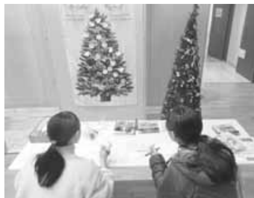
昨年度のふれあいまつりの様子