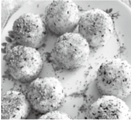
好きな具材でにぎったおにぎり

また、地域の人の協力で実現したリンゴ狩りは、採れたてのリンゴをそのまま丸かじり。おいしいリンゴ