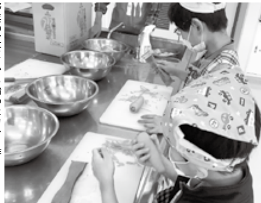
野菜の皮むきから始めたカレー作り

を味わいながら、あいさつや会話を通じた地域の人のふれあいも体験する機会にもなりました。