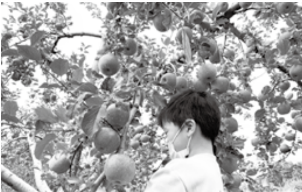
地域の人の協力で実現したリンゴ狩り